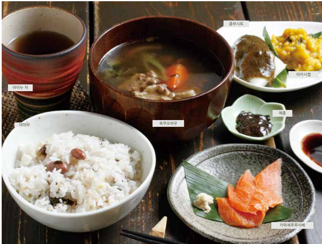
※계절에 따라 메뉴가 변동되는 경우도 있습니다.

음식을 남기지 않는 지혜는, 식재료 본연의 매력을 끌어내어 부드러운 맛으로 승화시킨다